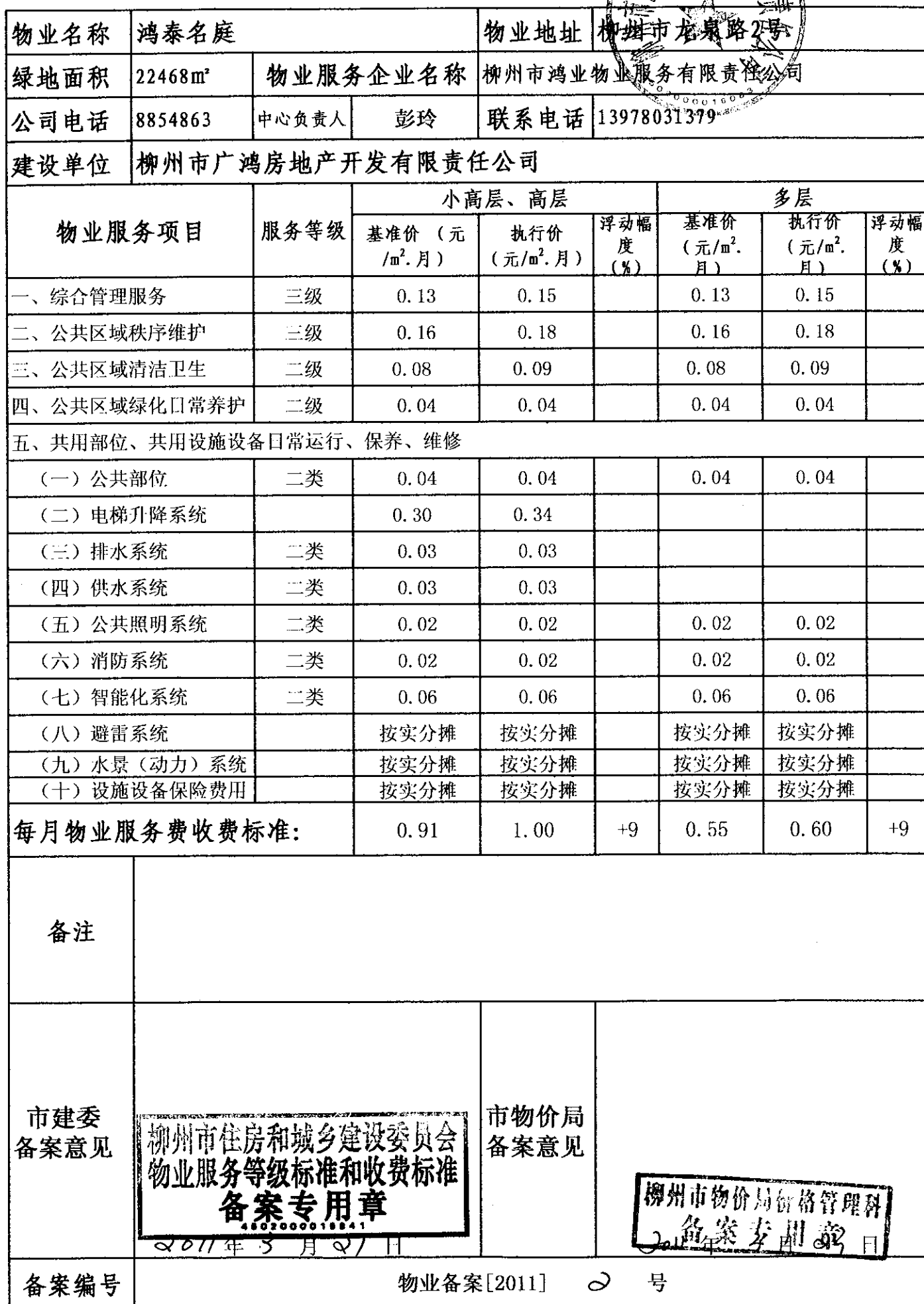
柳州市物业服务等级标准和收费标准备案表