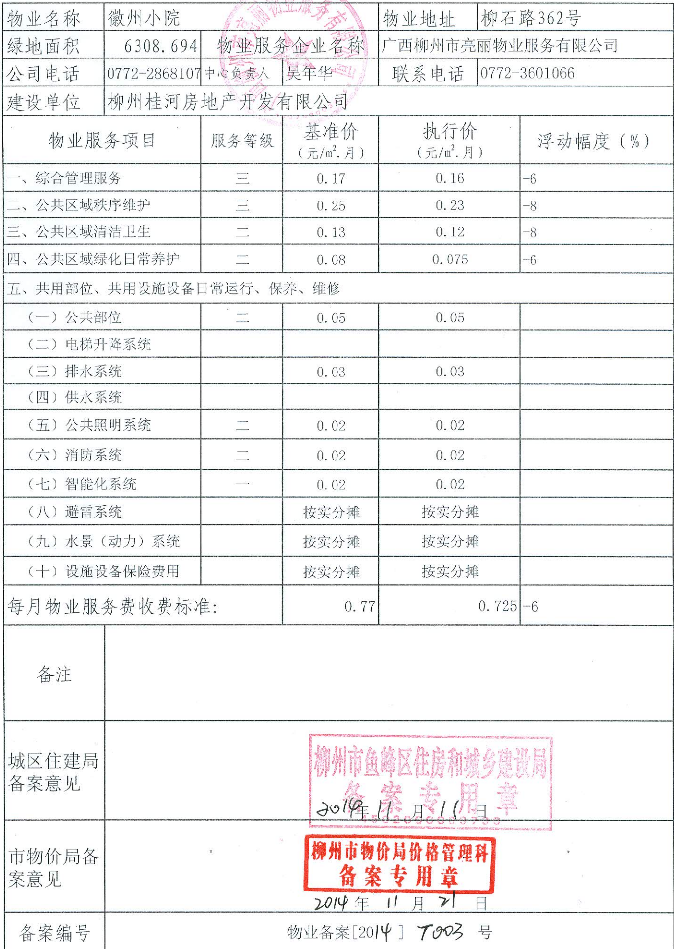
柳州市物业服务等级标准和收费标准备案表